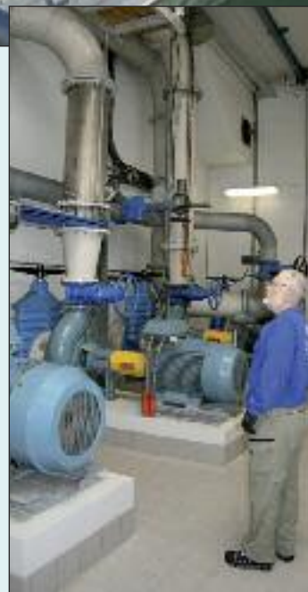
Det er kraftige pumper, der findes på rensesanlægget.

centralrensningsanlægget i Frederikshavn, mobil: 2948 6141, så finder han en tid, hvor en gruppe kan komme på besøg. Han modtager ikke enkeltpersoner. Det bliver for omfattende, men gerne grupper, der kan komme i dagtimerne. En rundvisning med forklaring tager 2 ½ til 3 timer. Så har du også fået en grundig forklaring, så du har et flot overblik over, hvordan spildevand renses i din kommune.