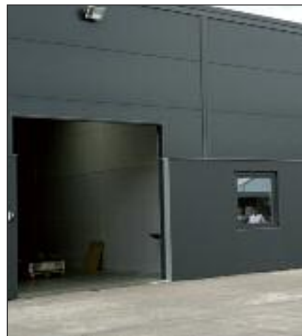
Det nye renseshus på Langerak.